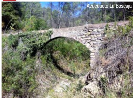
Acueducto La Boscaja